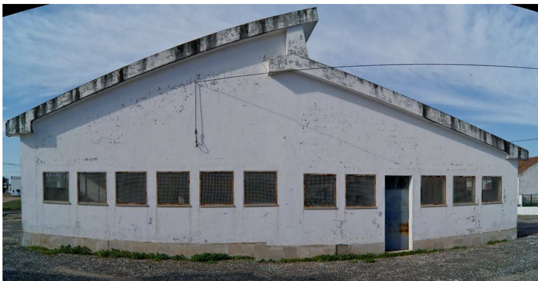
Figura 2 Imagem atual do Mercado de Galveias