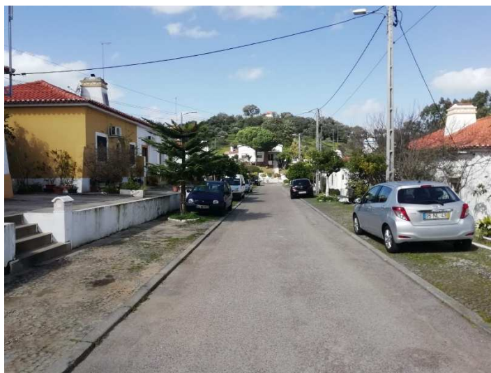
Figura 6 Fundação Dona Maria Clementina Godinho de Campos