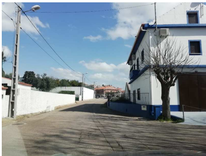
Figura 5 Fundação Dona Maria Clementina Godinho de Campos