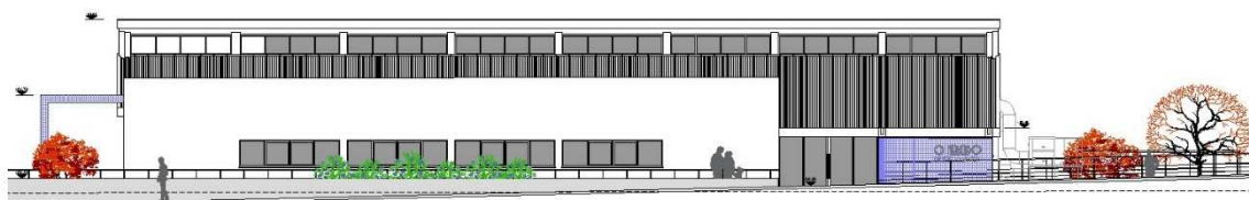
Figura 4 Imagem proposta para o Mercado de Galveias