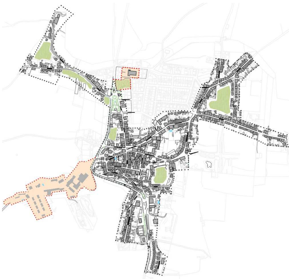
Figura 1 - Proposta de alteração da delimitação da ARU da Vila de Galveias