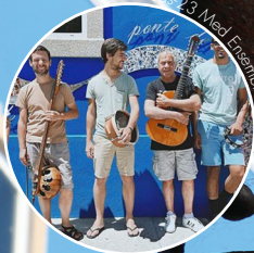
23 Med Ensemble