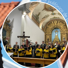
Coral polifônico de ponto de vista