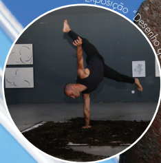
Exposição "Desenho que Dá para Dançar"