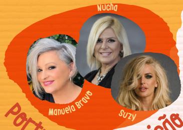
Portugal na Eurovisão