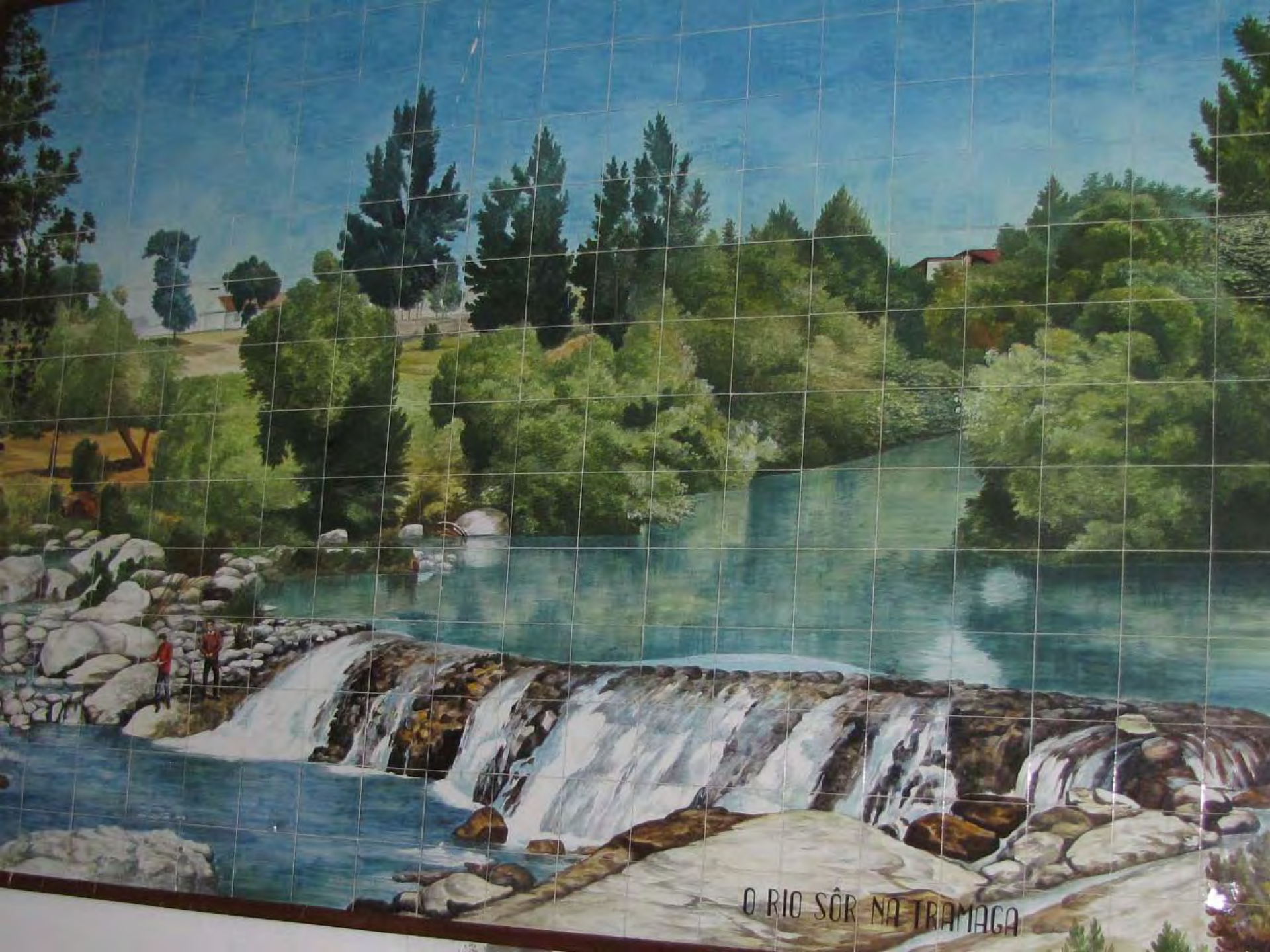
O RIO SÔR NA TRAMAGA